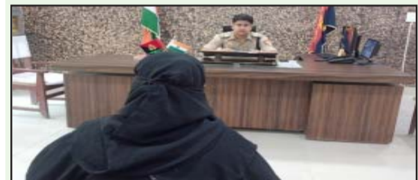
यूपी फाइट टाइम्स