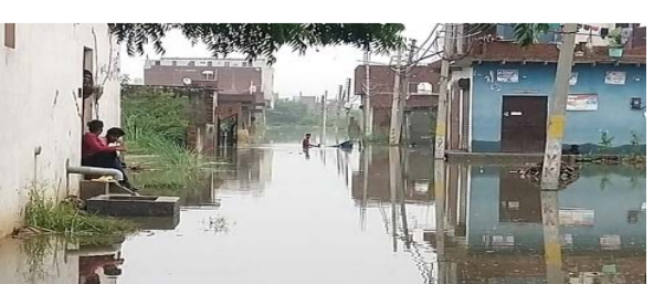
विधानसभा क्षेत्र की दौलत नगर कॉलोनी काफी ढलान वाले इलाके में बनी है। यहां करीब 60 से 70 मकान होंगे जिनमें दो-ढाई सौ लोग रहते हैं। एनडीआरएफ की टीम ने रविवार रात 33 लोगों को यहां से सुरक्षित निकाला था। कई लोग अपने छत ऊपर अपना डेरा

से 12 फुट तक पानी भरा हुआ है। लोग तरकर, पानी में घुसकर घरों से बाहर आने-जाने को मजबूर हो रहे हैं। प्रशासन में निकाले गए लोगों को पास के ही शेल्टर होम भेज दिया है जहां उनके खाने-पीने की व्यवस्था की गई है। गाजियाबाद के लोनी