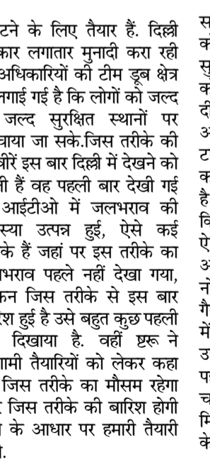
का जलस्तर 206 मीटर तक बढ़ता है तो बाढ़ की आशंका से इनकार नहीं किया जा सकता। इस बार से लगभग 40 हजार लोग की जा रही हैं। नालों की निगरानी के लिए टीमों को लगाया गया है, ताकि वहां पर कूड़ा या कोई कचरा ना

नई दिल्ली। आम आदमी पार्टी के नेता और पंजाब से राज्यसभा सदस्य राघव चड्ढा के सरकारी बंगला खाली करने के मामले में सोमवार को सुनवाई टल गई है। मामले में पटियाला हाउस कोर्ट में अब अगली सुनवाई 10 अगस्त को होगी। बता दें कि राघव चड्ढा ने पटियाला हाउस कोर्ट में मुकदमा दायर कर राज्यसभा सचिवालय के उस पत्र को चुनौती दी है, जिसमें उन्हें सरकारी आवास के तौर पर आवंटित टाइप सात बंगला खाली करने को कहा गया है।याचिका में कहा गया है कि पूरी प्रक्रिया के बिना ऐसे किसी सांसद को आवंटन रद्द करने का नोटिस जारी करना गैरकानूनी है। चड्ढा ने कोर्ट में याचिका दायर की थी। उल्लेखनीय है कि इससे पहले आठ जून को राघव चड्ढा को सरकारी बंगला आवंटन रद्द होने के मामले में अदालत से राहत मिली थी। कोर्ट ने मामले की अगली सुनवाई तक राज्यसभा सचिवालय के सरकारी बंगला आवंटन रद्द होने संबंधी आदेश पर रोक लगाई थी।