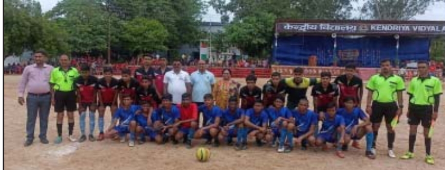
01 एवं केन्द्रीय विद्यालय बबीना के मध्य फाइनल मैच खेला गया

फाइनल केन्द्रीय विद्यालय क्रमांक-01 और केन्द्रीय विद्यालय क्रमांक-02 आगरा कैंट के बीच खेला गया तथा विजेता केन्द्रीय विद्यालय क्रमांक-03 आगरा कैंट रहा। अण्डर-14 के अन्तर्गत फाइनल मैच केन्द्रीय विद्यालय बबीना कैंट और केन्द्रीय विद्यालय नोएडा सेक्टर-24 शिफ्ट-01 के बीच खेला गया तथा विजेता केन्द्रीय विद्यालय नोएडा सेक्टर-24 शिफ्ट-01 रहा। छात्राओं में केन्द्रीय विद्यालय नोएडा सेक्टर-24 शिफ्ट