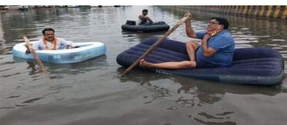
जमा चुके हैं। अब एक बार फिर प्रशासन और पुलिस के लोग धीरे-धीरे यहां पर पहुंचने शुरू हो गए हैं। जो लोग घर पर हैं उनसे अपील की जा रही है कि वे वहां से निकल जाएं। अगर उन्हें मदद की जरूरत है तो एनडीआरएफ की टीम को बता सकते हैं।