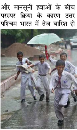
रही है। जिसमें दिल्ली भी शामिल है, जहां मौसम की पहली बहुत भारी बारिश हुई। सीएम केजरीवाल ने कैसल की अधिकारियों की संडे की छुट्टी इसी बीच दिल्ली के मुख्यमंत्री अरविंद केजरीवाल ने आज सभी विभागों के अफसरों को संडे की छुट्टी को कैसल कर दिया और उन्हें काम करने के निर्देश दिए हैं। टोटल बारिश का 15वें मात्र 12 घण्टे में बरसा। इससे जलभराव कि स्थिति पैदा हुई, जिससे लोग काफी परेशान हुए, इसी को ध्यान में रखते हुए उन्होंने कहा कि आज दिल्ली के सभी मंत्री और मेयर परेशानी ग्रस्त इलाकों को इंपेक्शन करेंगे। साथ ही सभी विभागों के अफसरों को संडे की छुट्टी कैसिल कर ग्राउंड पर उतरने के निर्देश दिए हैं।

नई दिल्ली। दिल्ली में दो दिन से लगातार हो रही बारिश से जलभराव की स्थिति पैदा कर दी है। जिससे लोगों को आने जाने में काफी परेशानी का सामना करना पड़ रहा है। इसको लेकर मौसम विभाग ने येलो अलर्ट भी जारी कर दिया है। इसी बीच दिल्ली के मुख्यमंत्री अरविंद केजरीवाल ने रविवार को घोषणा की है किदिल्ली के सभी स्कूल सोमवार को एक दिन के लिए बंद रहेंगे। एक दिन के लिए दिल्ली के सभी स्कूल हूए बंद दिल्ली के मुख्यमंत्री अरविंद केजरीवाल ने ट्वीट कर इस बारे में जानकारी दी। उन्होंने कहा कि दिल्ली में पिछले 2 दिनों से हो रही मूसलाधार बरसात और मौसम विभाग की चेतावनियों को ध्यान में रखते हुए एक दिन के लिए बंद किया जा रहा है। पश्चिमी विक्षोभ और मानसूनी हवाओं का प्रकोप जारी बता दें कि पश्चिमी विक्षोभ