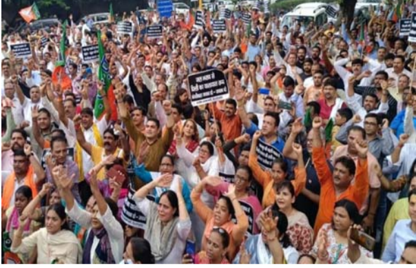
दिल्लीवासी इस गंभीर समस्या से जूझ रहे थे और मुख्यमंत्री पंचकूला में चुनाव प्रचार में व्यस्त थे।