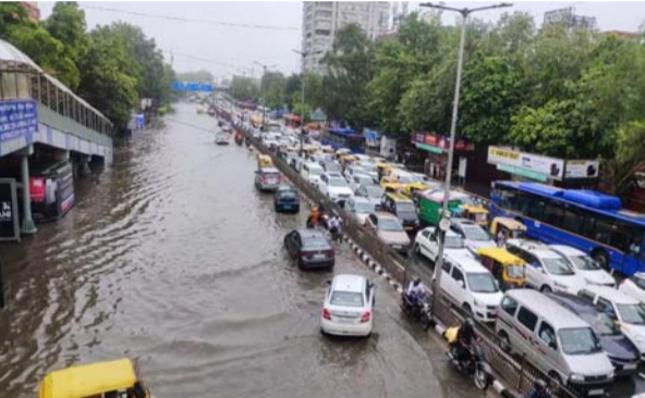
दिल्ली के उपराज्यपाल वी के सक्सेना से मांग की है कि दिल्ली के सीवर एवं ड्रेनेज सिस्टम का तकनीकी ऑडिट किया जाए और पिछले सालों में दिल्ली के ड्रेनेज एवं सीवर सिस्टम पर दिल्ली जल बोर्ड, दिल्ली नगर निगम, दिल्ली सरकार, नई दिल्ली नगर परिषद एवं

दुकानदारों को हुए नुकसान की भरपाई की मांग कर रहे हैं। वैसे, सोमवार को भी बाजारों की स्थिति में ज्यादा सुधार नहीं आया है, अब कीचड़ और मलबा जमा है। बारिश ने राष्ट्रीय राजधानी में किया जाह्रि माम दिल्ली में दो दिन की बारिश ने दिल्ली को वर्ल्ड क्लास शहर बनाने के सरकार के दावों की पोल खोल दी है। पूरी दिल्ली में सड़कों पर पानी और सारी दिल्ली को नदी नाले के रूप में परिवर्तित होने पर कंफेडरेशन ऑफ आल इंडिया ट्रेडर्स (कैट) ने गंभीर चिंता व्यक्त की है। कैट