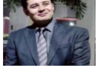
जुआ अधिनियम व ऐसे समस्त प्रकार के वाद जो सुलह समझौते के आधार पर निस्तारित हो सकते हो ऐसे ऐसे विवाद भी जो न्यायालय के समक्ष अभी नहीं आये है उनका भी प्री-लिटिगेशन स्तर पर सुलह समझौते के आधार पर इस राष्ट्रीय लोक अदालत में निस्तारण किया

शाहजहांपुर। उच्च न्यायालय इलाहाबाद के निर्देशानुसार आरबीट्रेषन वादों के निस्तारण हेतु विशेष लोक अदालत का आयोजन करने हेतु निर्देशित किया गया है। जिस हेतु जनपद न्यायालय शाहजहांपुर में लम्बित आर्बीट्रेषन से सम्बन्धित मामलों का अधिक से अधिक निस्तारण किये जाने हेतु दिनांक 21.01.2023 को विशेष लोक अदालत का आयोजन किया जायेगा। साथ ही साथ 30 प्र0 राज्य विधिक सेवा प्राधिकरण लखनऊ के निर्देशानुसार राष्ट्रीय लोक अदालत का आयोजन