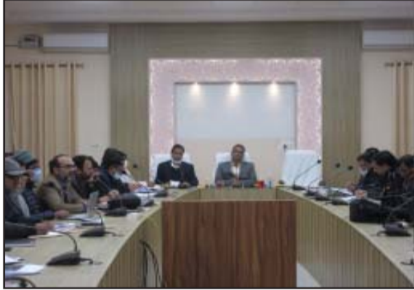
प्रशिक्षण कराये जाने हेतु भी जिलाधिकारी ने निर्देशित किया। जिला अधिकारी उमेश प्रताप सिंह की अध्यक्षता में कलेक्ट्रेट सभागार में राष्ट्रीय फाइलेरिया उन्मूलन कार्यक्रम के अन्तर्गत जनपद में दिनांक 10 से 27 फरवरी 2023 तक चलाये जाने वाले फाइलेरिया एम०डी०एम० अभियान के संबंध में प्रथम अन्तर्विभागीय बैठक सम्पन्न हुई। बैठक के दौरान जिलाधिकारी ने निर्देश दिये

में भी नियमित टीकाकरण में सुधार हेतु जिलाधिकारी ने निर्देश दिये। उन्होंने डीसीपीएम को नोटिस जारी करने के निर्देश देते हुये चेतावनी दी की कार्य में सुधार न होने पर सेवा समाप्त की जायेगी। मीजल्स रूवेला के विशेष टीकाकरण अभियान हेतु भी सम्बन्धित अधिकारियों को निर्देश दिये। उन्होंने कहा कि सत्र आयोजन से पूर्व बुलावा पर्ची अवश्य दी जाये तथा सत्र का आयोजन नियमित रूप से कराया जाये। ग्राउण्ड लेवल स्टाफ के संवेदीकरण हेतु